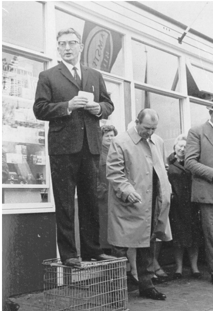
Uit het feestprogramma van het Eerste Lustrum, 1967

Lustrum Indien U het programma heeft doorgelezen, zult U wel beseffen dat vele van niet te noemen voorwerpen in handen liggen van onze werkers voor het jaugboek. Daarbij kunnen wij U nog verzoeken dat het ook deze werkers even als een attentie het aandacht deden in ook het lustrum-programma te voorzien, dat wij hierin geolagd zijn getoelge dit lustrum. Over het programma kunnen wij nog zeggen dat wij hopen dat het naar de smaak is. Wij hopen U dat ook bij de vele waarmaken mogen ontvangen, hetzij op de dans- of klaverjansavond, of bij een concert, of zelfs als deelnemer op de leden-vergadering. Wij wensen U veel plezier. Daar bij het afsluiten van dit programma enkele concerten nog geven, vaste vorm hebben getrogen, wester wij de contractie hiervan verlichten dat wijziging van het programma niet mogelijk is. Mensen het lustrum, W. Swilling, secretaris