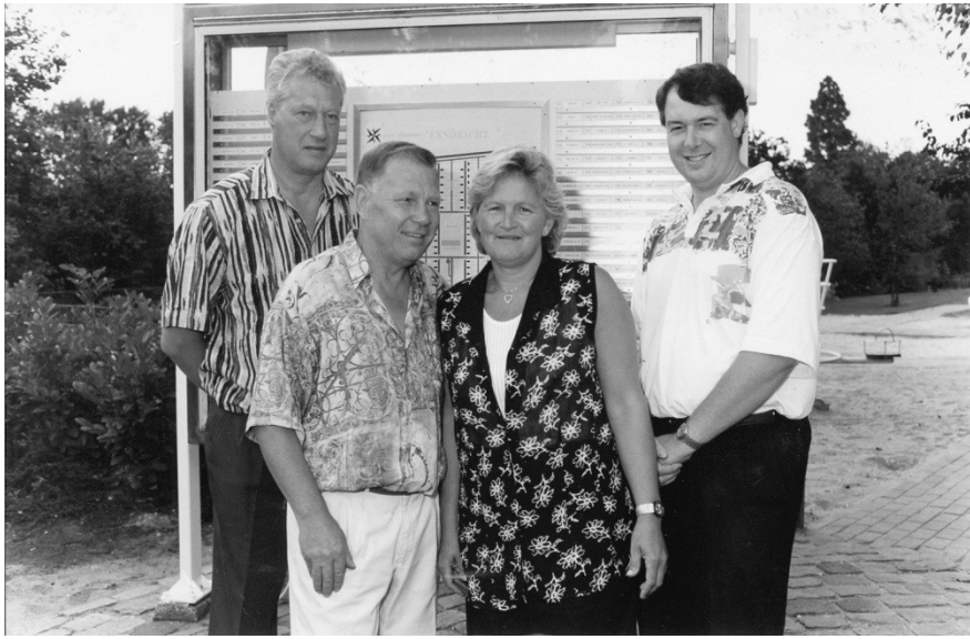
het bestuur in de jaren negentig, voorzitter en penningmeester in 2008