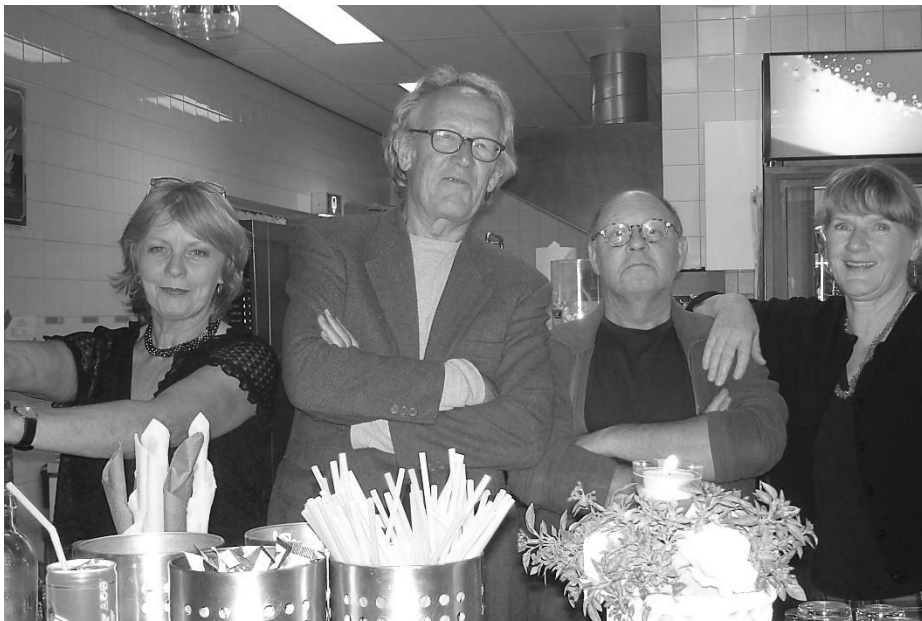
het bestuur in 2008, het bestuur in 2012